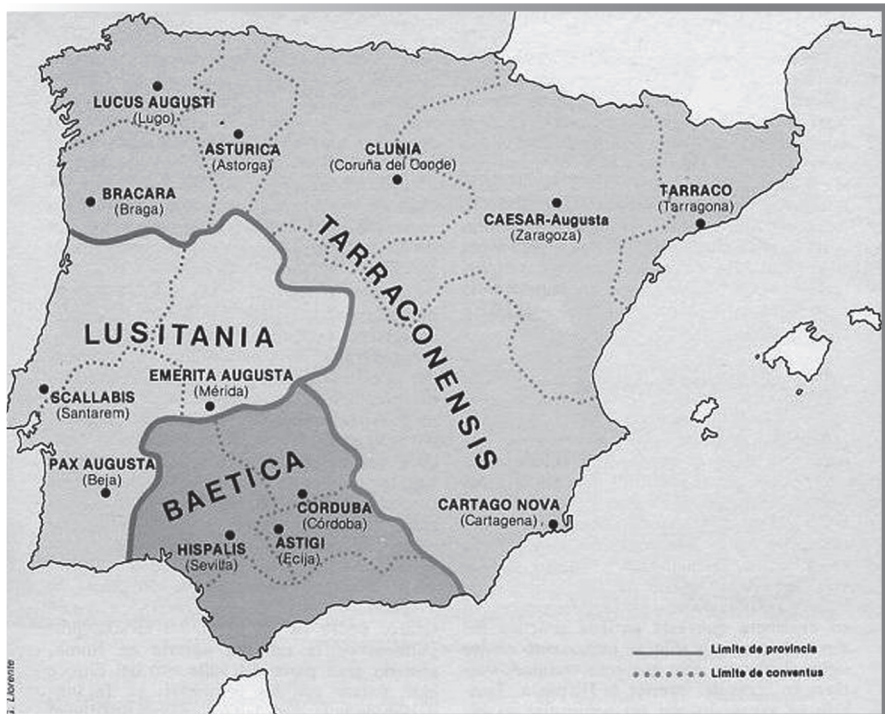
Hispania a l'època de Pau